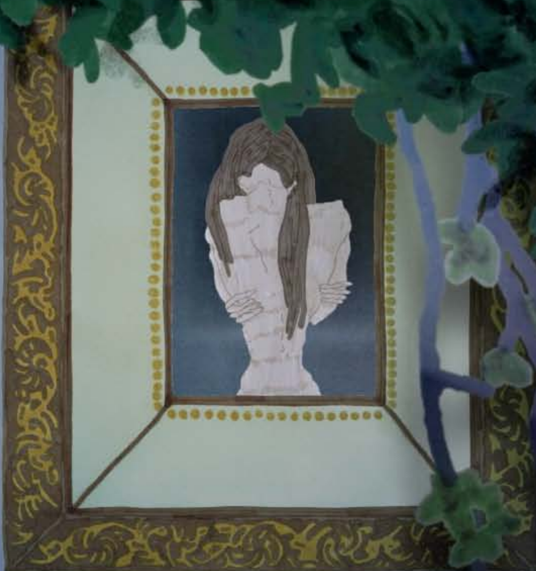
La séquestrée de poitiers