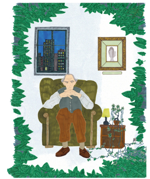
Illustrations de Marine de Franceville et Claire Vallès