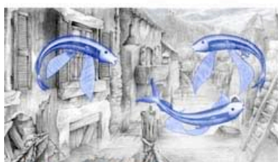
Prix de la SACD au concours de projets du Festival d'Annecy