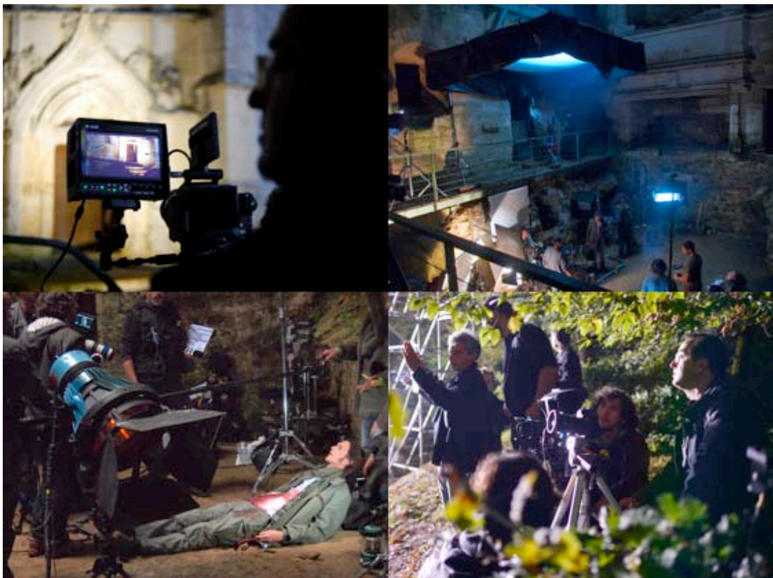
Le tournage de nuit