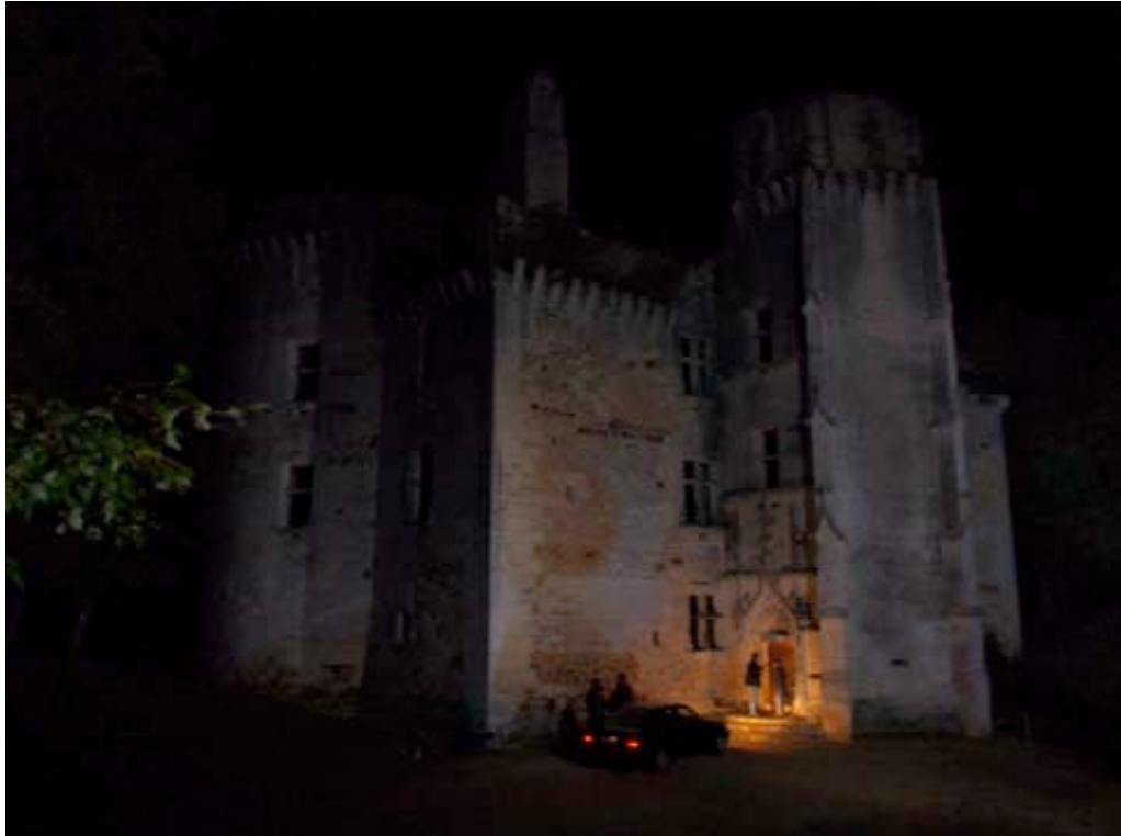
L'imposant Château de l'Herm en Dordogne