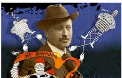
Prix Les étoiles de la SCAM 2010 Prix du jury Festival Shanghai (Ch)

Jeune fille de province repérée par le monde du cinéma et du show business, la jeune Acapulco est devenue une véritable Diva avant de sombrer dans une implacable décadence. « Souviens toi d'Acapulco » est un portrait tant poétique que politique de la plus ancienne station balnéaire mexicaine.