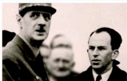
FIPA Biarritz 2011 Diffusion sur France 2