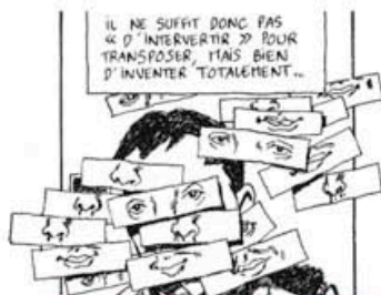
Festival d'Angoulême 2011